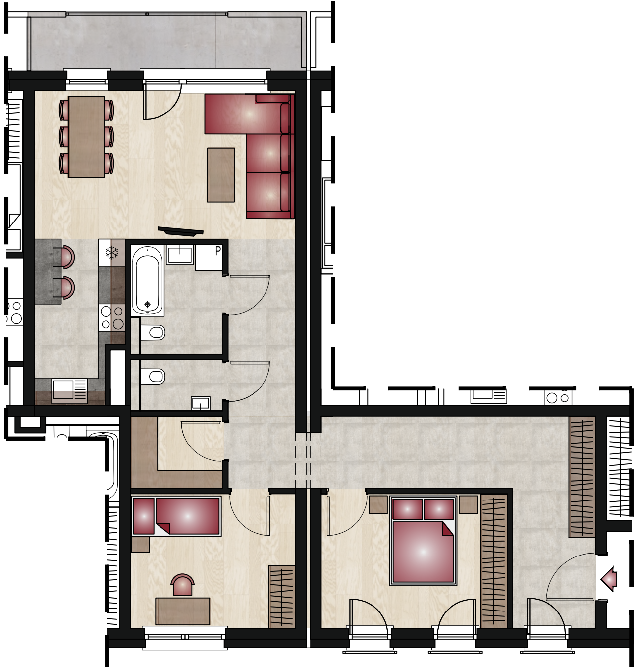
V.B.20 3P- 83,36 m 2